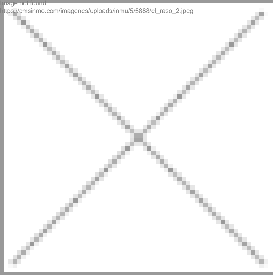
image not found https://cmsinmo.com/imagenes/uploads/inmu/5/5888/el_raso_2.jpeg