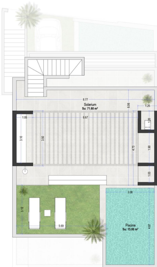
tabla de superficies