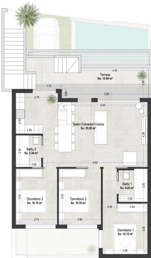
tabla de superficies