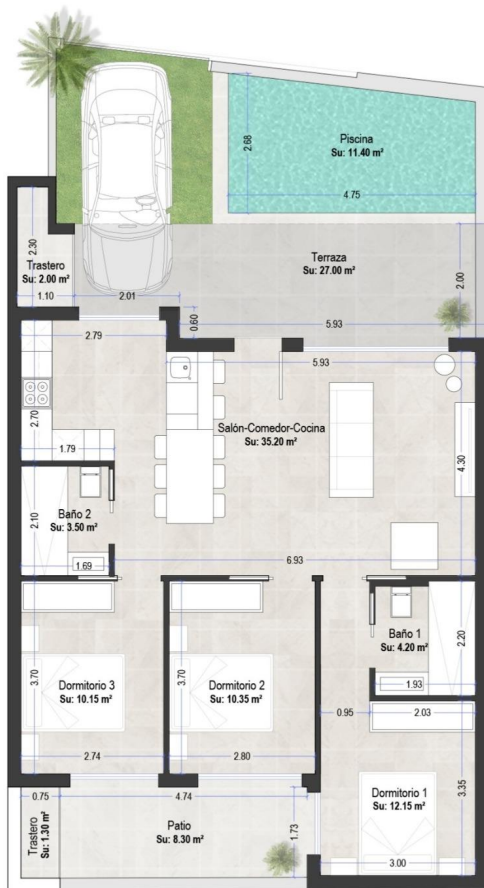
tabla de superficies