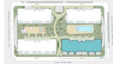
BLOQUE 1 - Planta Baja