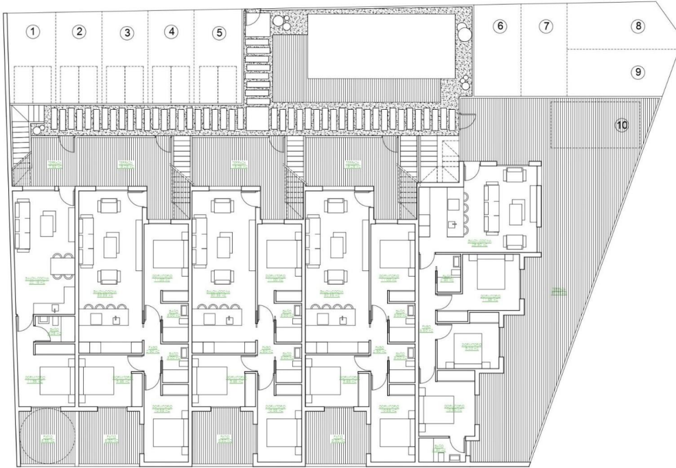
Planta Baja Conjunto

"Experience our experience - Because you deserve the best"