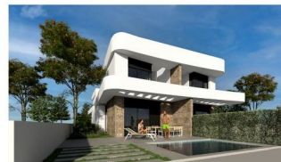
DIN A4 (1/75) 0 1 2 3 4 5