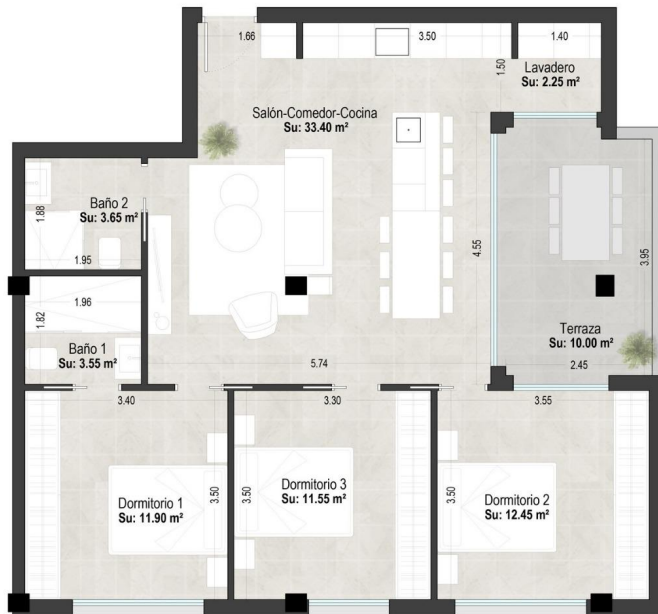
tabla de superficies