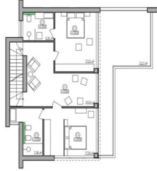
PLANTA PRIMERA 111 m 2