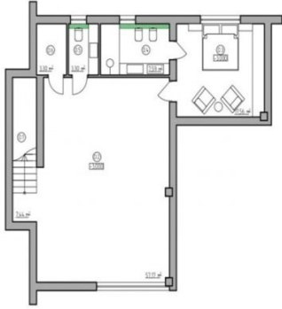
PLANTA SÓTANO 96 m 2