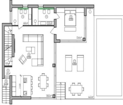
PLANTA BAJA 143 m 2