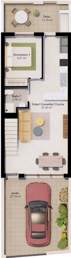
PLANTA BAJA GROUND FLOOR