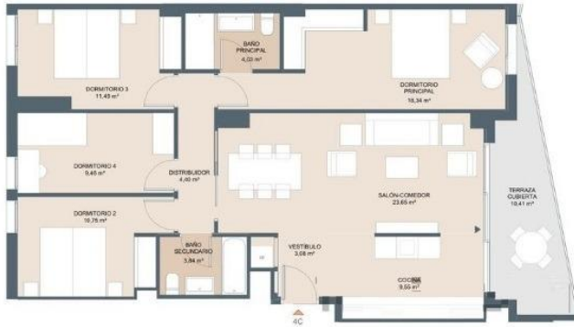
Esc. 1 P04-C