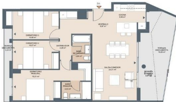
Esc. 2 P05-A