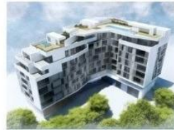
Superficies: Vivienda 3d