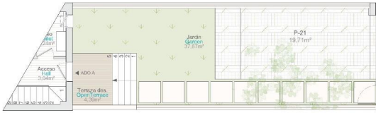
Planta baja | Ground Floor