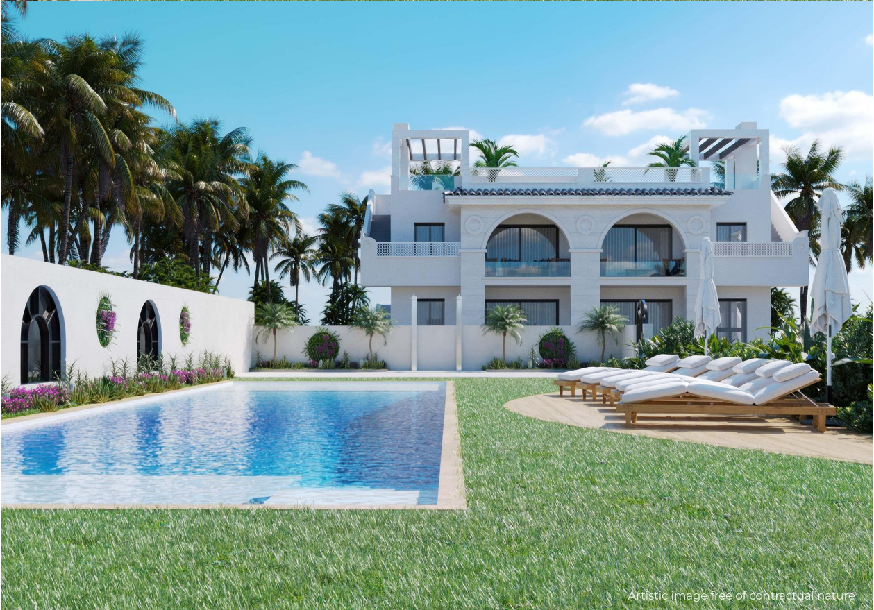
Artistic image free of contractual nature