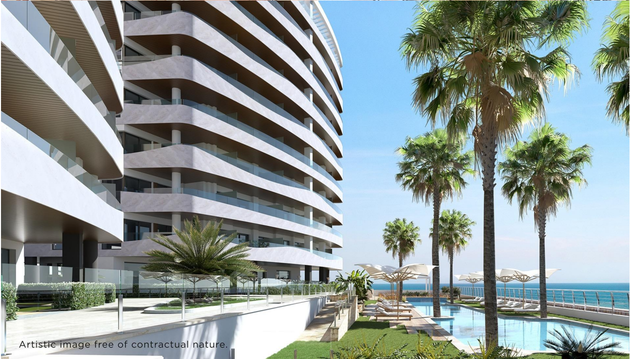
Artistic image free of contractual nature.