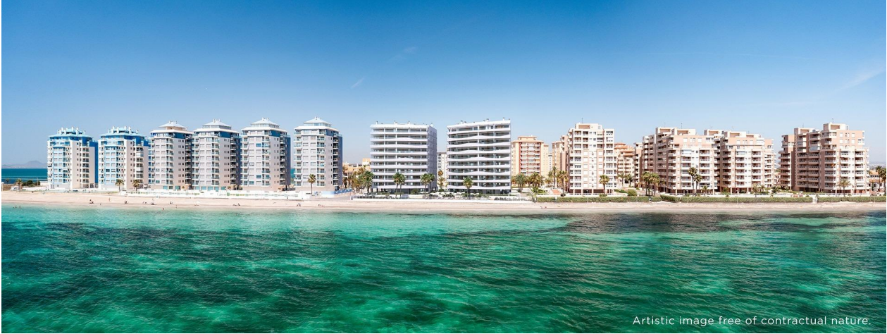
Artistic image free of contractual nature.