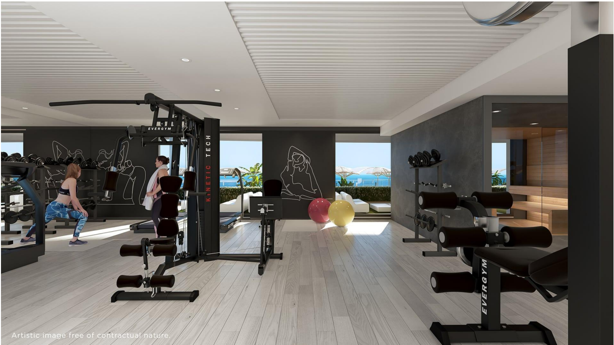
Artistic image free of contractual nature.