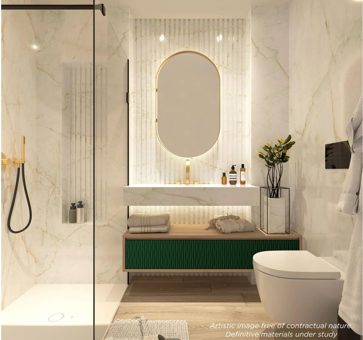
Artistic image free of contractual nature. Definitive materials under study