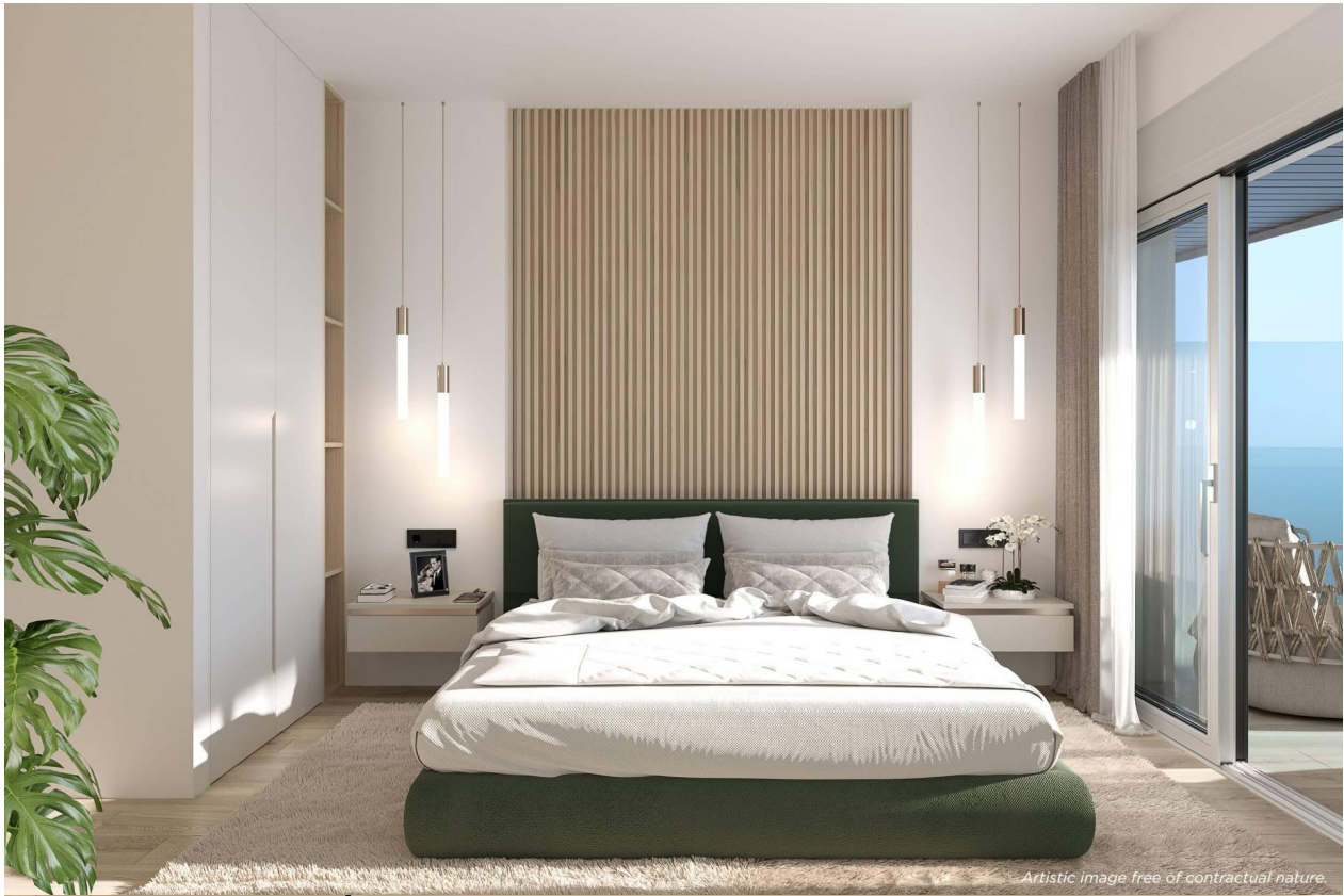
Artistic image free of contractual nature.