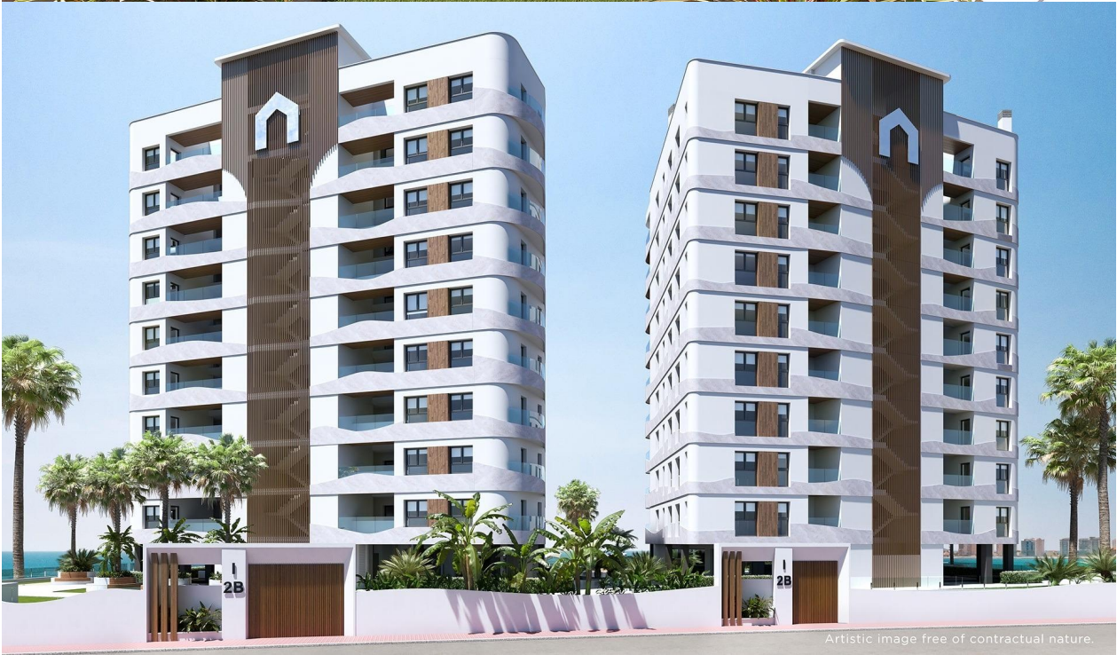
Artistic image free of contractual nature.