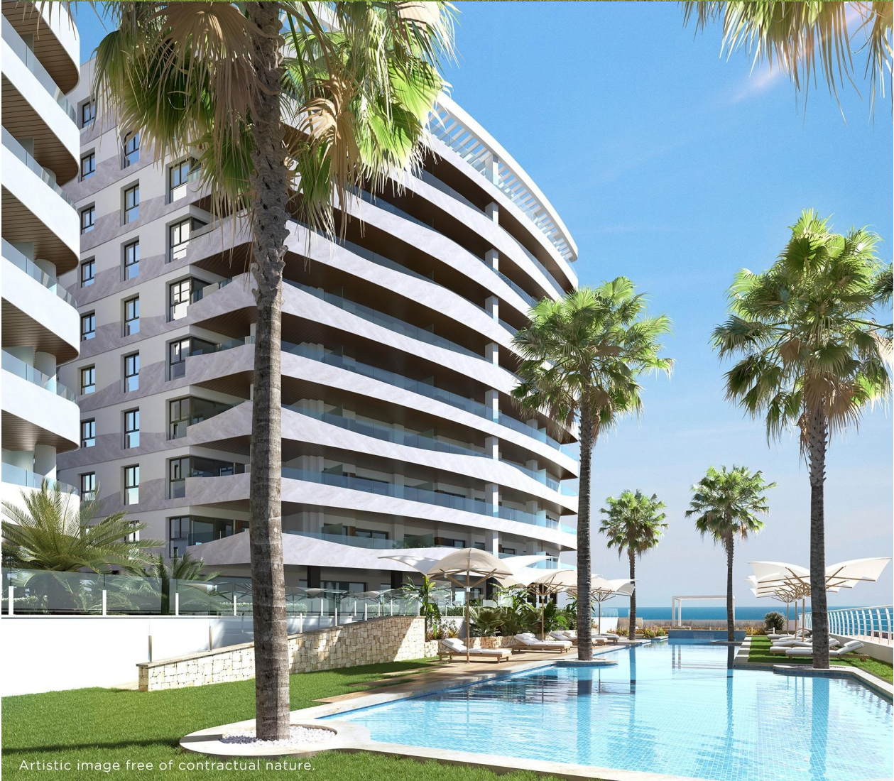
Artistic image free of contractual nature.