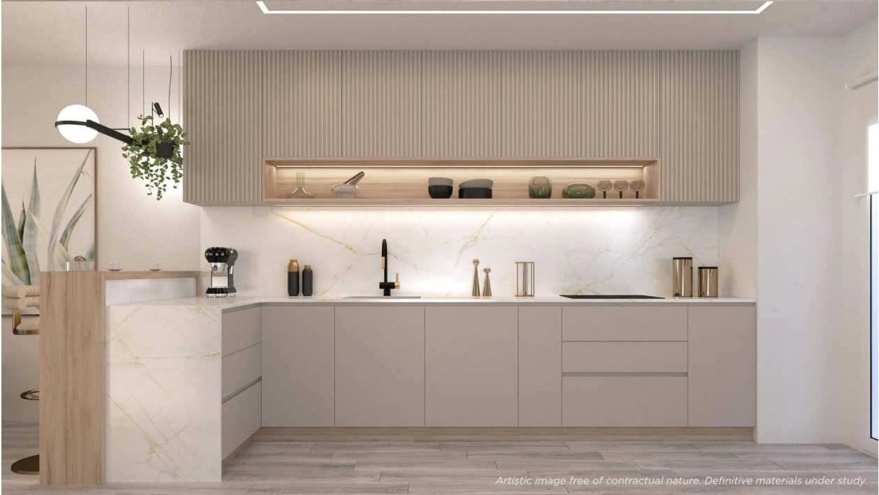
Artistic image free of contractual nature. Definitive materials under study.