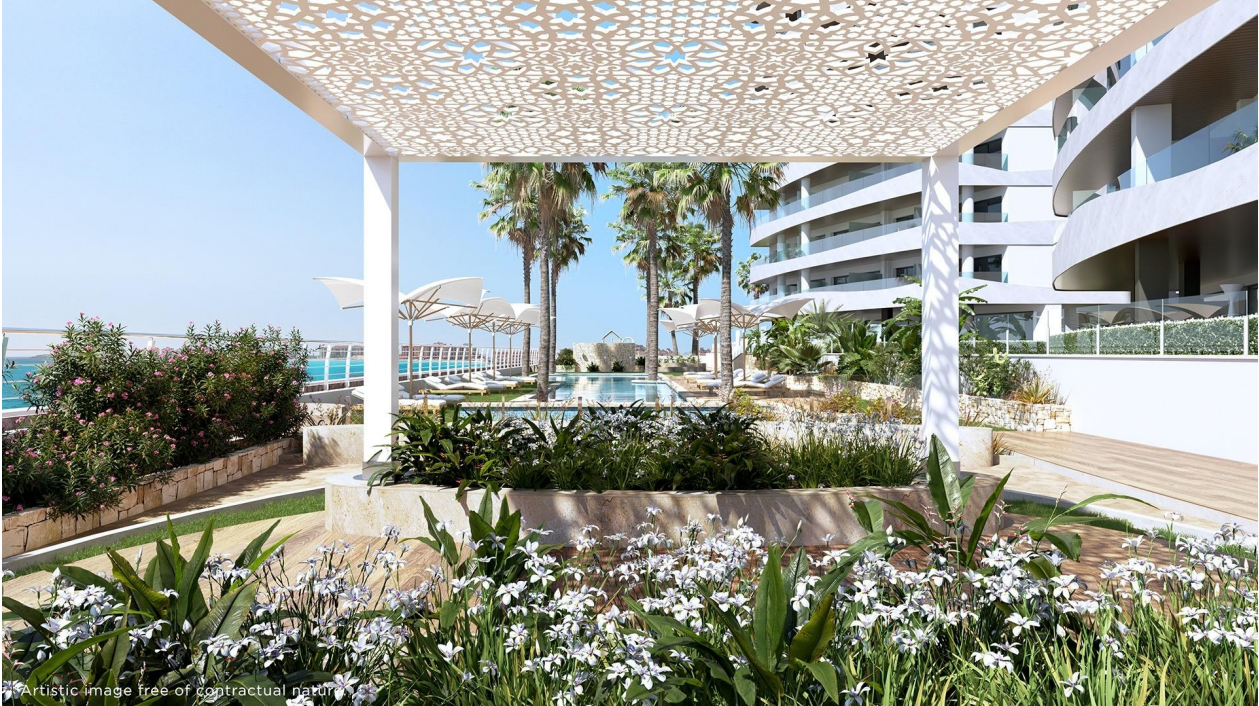
Artistic image free of contractual nature