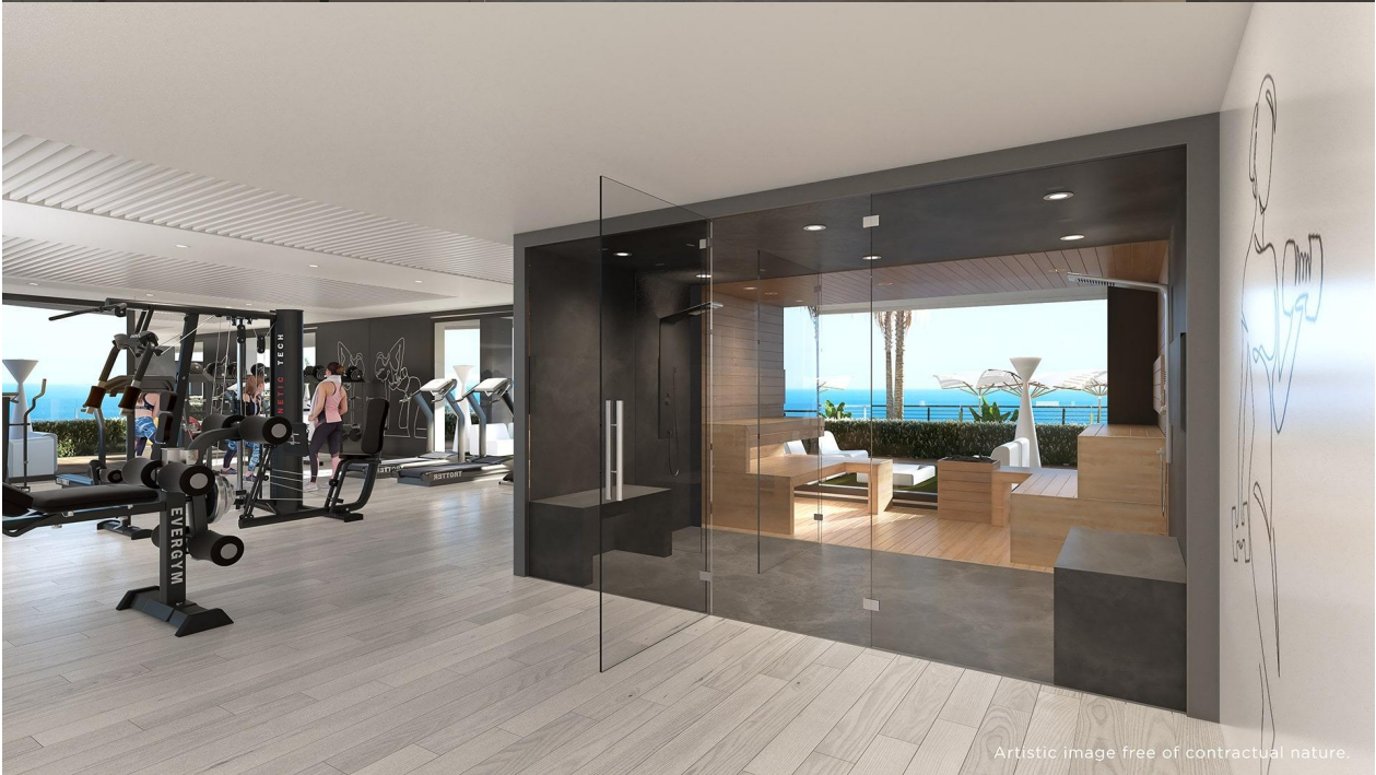
Artistic image free of contractual nature.