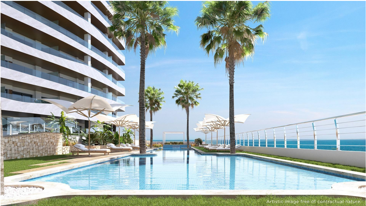
Artistic image free of contractual nature.