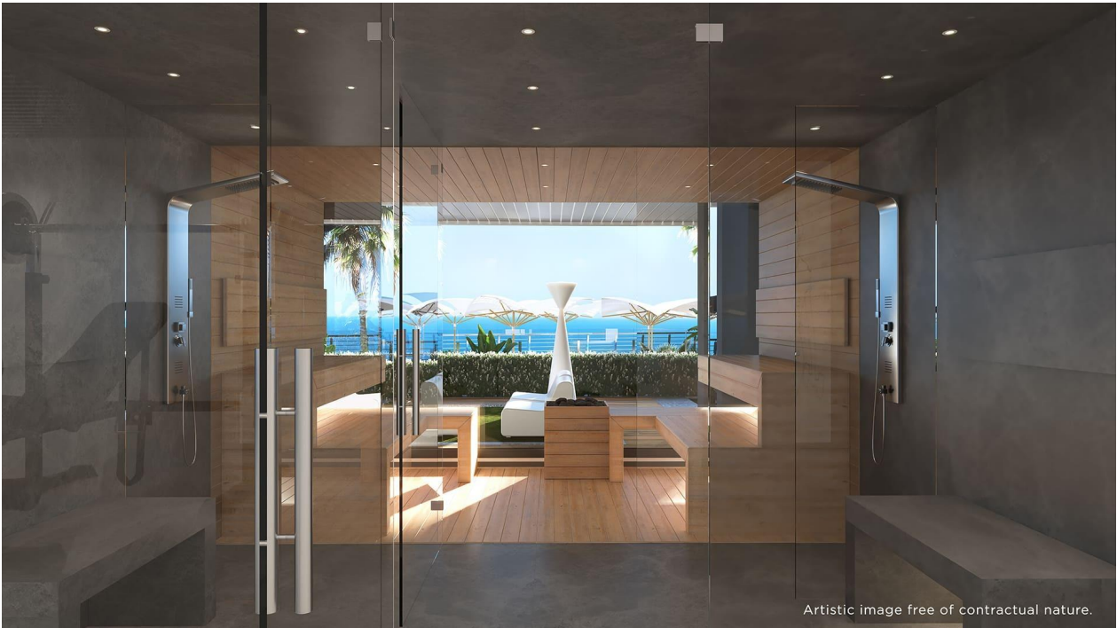
Artistic image free of contractual nature.