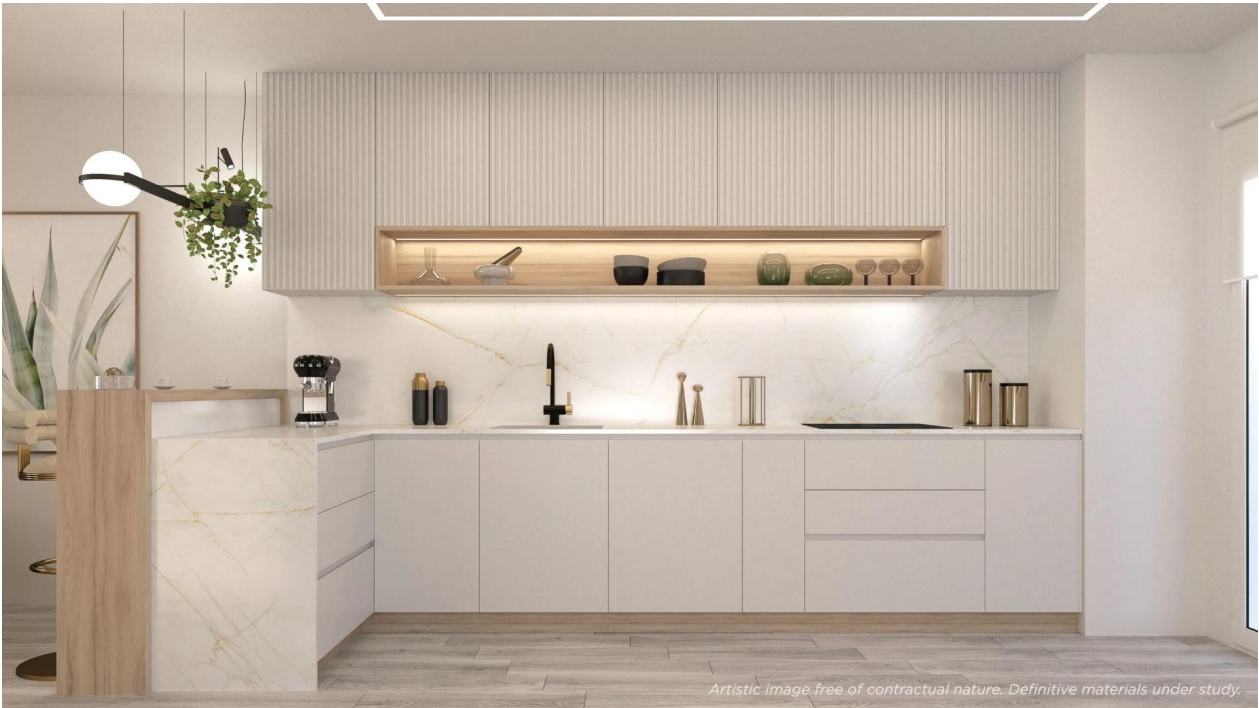
Artistic image free of contractual nature. Definitive materials under study.