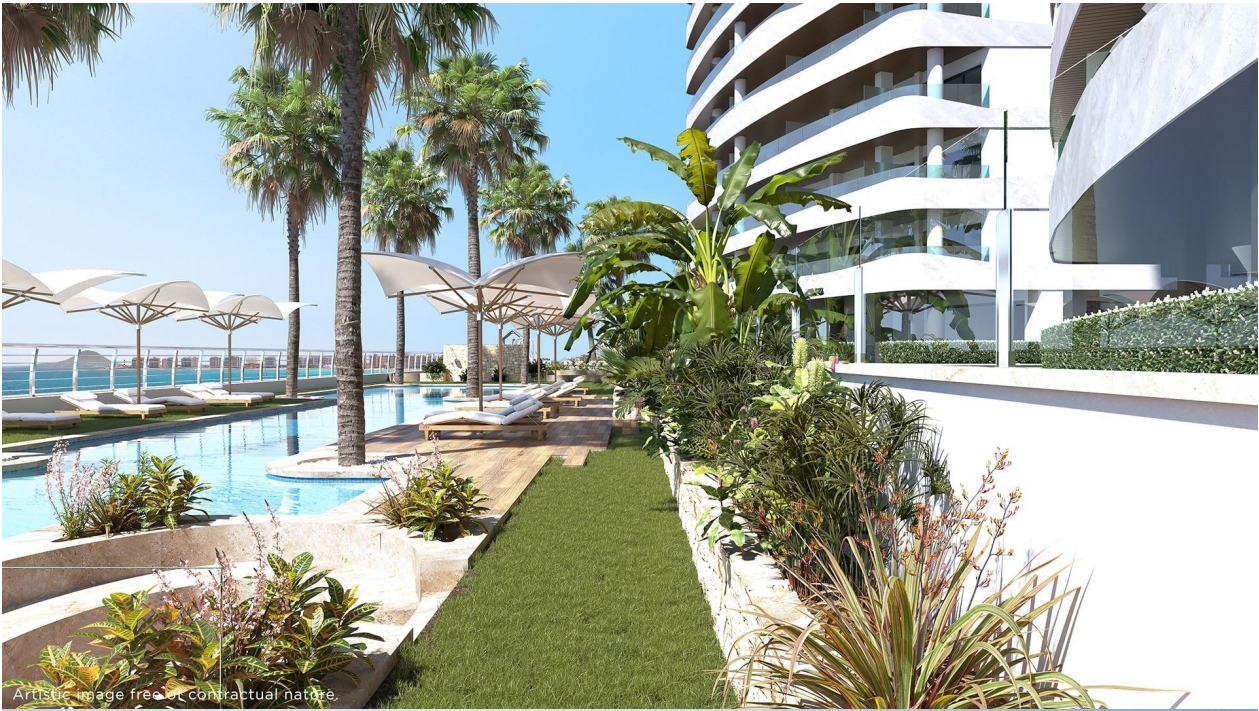
Artistic image free of contractual nature.