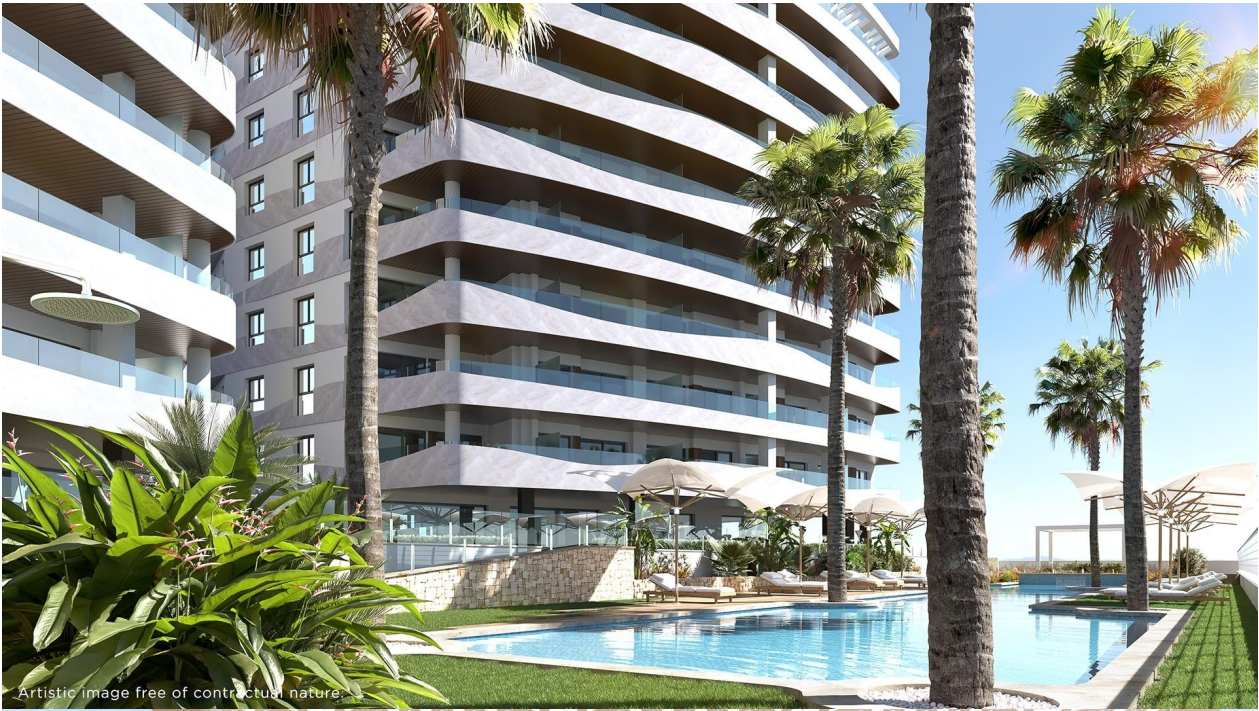
Artistic image free of contractual nature