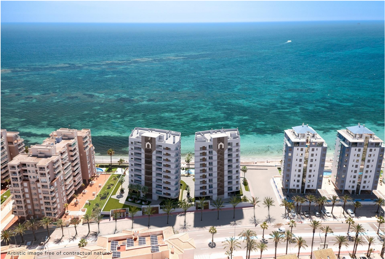
Artistic image free of contractual nature.