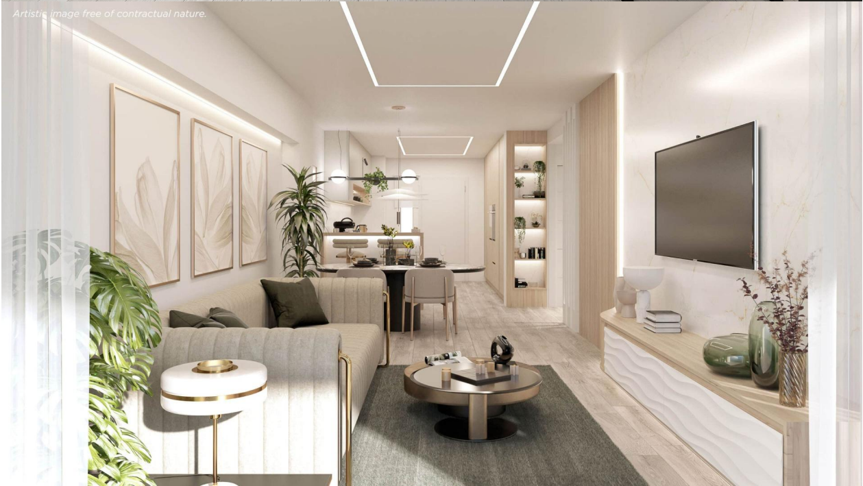
Artistic image free of contractual nature.