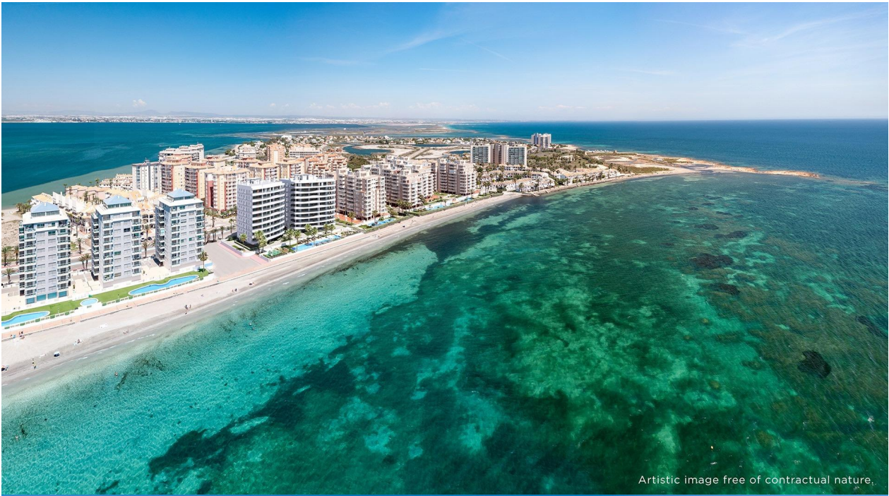
Artistic image free of contractual nature.