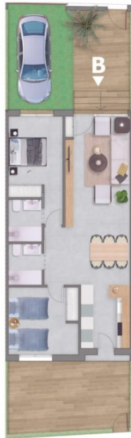
Planta baja / Ground Floor