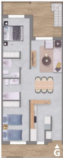
Planta primera / First Floor