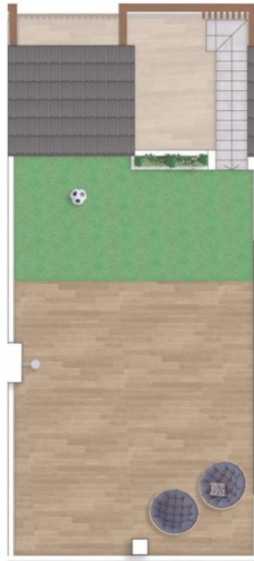
Planta solarium/ Topfloor