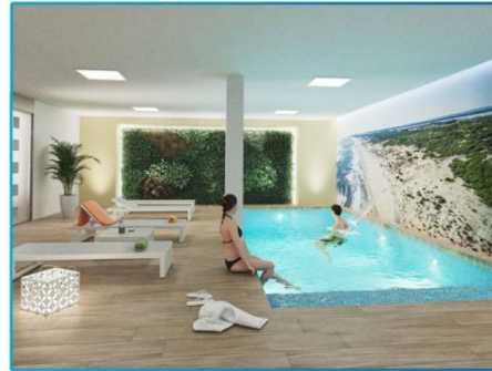
PISCINA / SWIMMING POOL

- Plano realizado sobre proyecto básico, las cotas o superficies facilitadas podrían verse ligeramente alteradas en fase de ejecución -