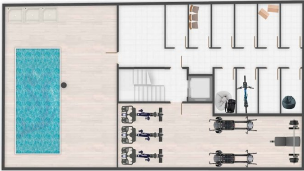
SÓTANO / BASEMENT