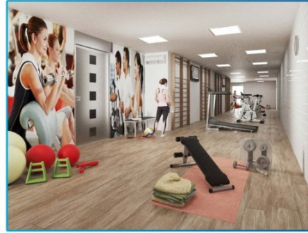
GIMNASIO / GYM