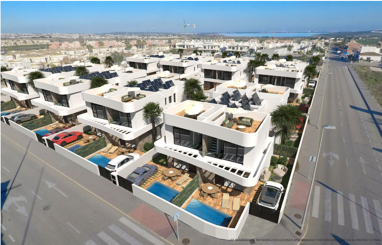
LAS IMÁGENES SE REFIEREN A SOLUCIONES APROXIMADAS Y NO SON VINCULANTES AL PROYECTO FINAL