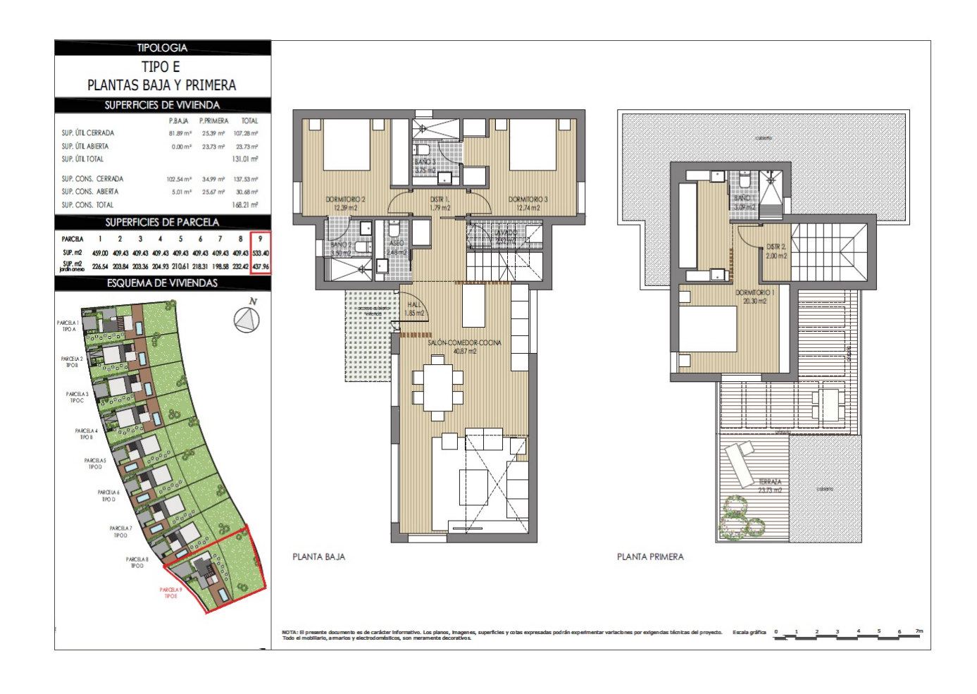
"Experience our experience - Because you deserve the best"